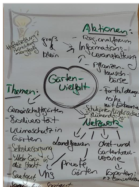
Abb. 1: Themen-Brainstorming