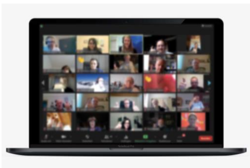
Die LILE-Auftaktveranstaltung mit über 60 Teilnehmende war ein voller Erfolg

Zwischen Februar 2021 und 2022 bereiten sich die lokalen Aktionsgruppen auf die neue Förderperiode vor. Das bedeutet, dass die bestehenden LEADER-Regionen aber auch solche, die sich als neue LEADER-Region gründen möchten, eine neue Lokale Integrierte Ländliche Entwicklungsstrategie (LILE) erarbeiten, mit der sie sich beim