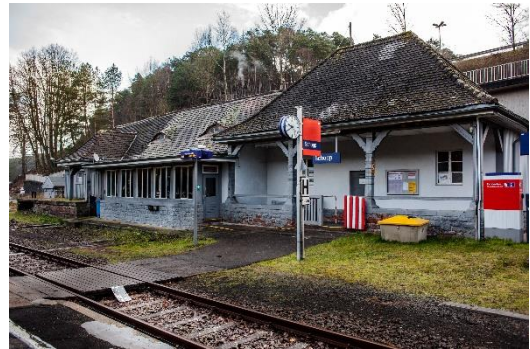
Alter Bahnhof Schopp

Mit 105 Punkten erreicht das Projekt „Informationscenter Bahnhof Schopp“ den ersten Platz. Mithilfe der Förderung richtet der private Investor eine barrierefreie Tourist-Info ein.