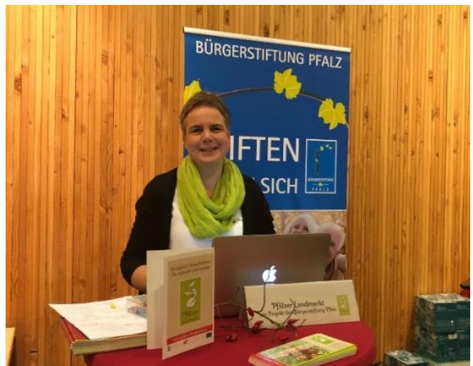
Vorstellung der Website beim letzten Regionalforum (20.11.2019)