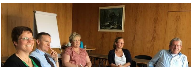
Arbeitsgruppe Dorfentwicklung und – gemeinschaft beim Brainstormen zum Regionalforum 2017

Sie wollen sich einbringen und mitplanen? Sie können jederzeit an unseren Arbeitsgruppen teilnehmen! Terminhinweise finden Sie auch hier auf unserer Website.